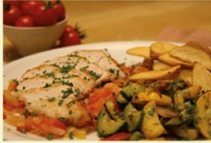
Hähnchenbruststreifen auf warmen Tomaten-Zwiebelsstückchen und mediterranem Gemüse mit Kartoffelflecken