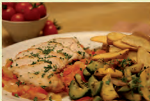
Hähnchenbruststreifen auf warmen Tomaten-Zwiebelschnitzeln und mediterranem Gemüse mit Kartoffelstücken